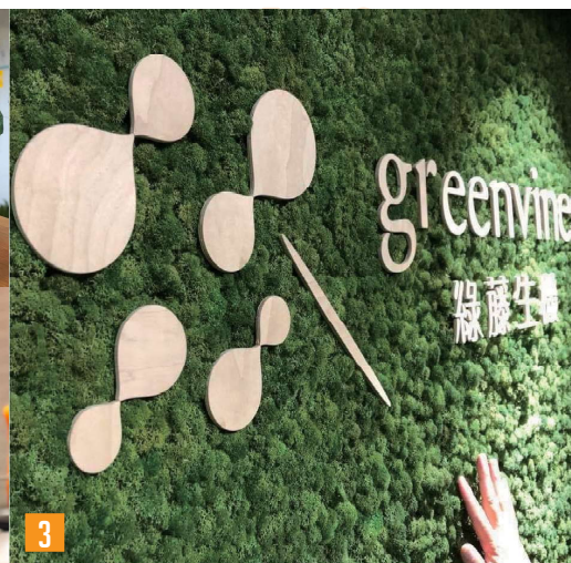
写真①： 1. きれいな空気の循環を感じるオフィスの居心地は抜群 2. 給湯室では食器洗いに自社シャンプー。安心の品質を証明 3. 会社正面には植物でつくられた看板。水やりも自分たちで