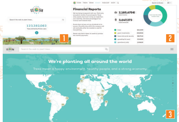
■検索エンジンEcosia | https://www.ecosia.org/

朝習慣からプラゴミを減らしていくライフスタイルメディア「morning baton」の編集長。世界のユニークでビジョンのあるエコ情報をセツカクドモ読者のみなさまにお届けします！